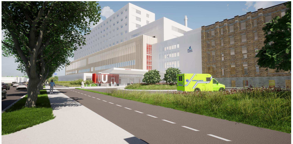
Le futur bâtiment destiné aux soins critiques vus du Boulevard Henri-Bourassa en direction nord.

D'importants travaux de coffrage et de bétonnage sont en cours pour construire le bâtiment destiné aux soins critiques qui est le plus bâtiment le plus imposant du projet. Ces opérations importantes en raison du volume de béton requis entraîneront une hausse du camionnage en direction du chantier. Également, à certains moments, des travaux de bétonnage pourraient avoir lieu de soir et de nuit. Toutes les mesures seront prises afin de limiter au maximum le bruit pour le voisinage.