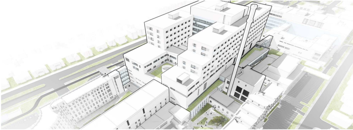
Enclavée entre le Pavillon Notre-Dame et le bâtiment destiné aux soins critiques, la nouvelle cheminée sera d'une hauteur de \pm 78 mètres.

L'installation d'une nouvelle cheminée est nécessaire au niveau du bâtiment des génératrices. Pour des raisons de norme de sécurité, cette nouvelle cheminée doit être plus élevée que le bâtiment des soins critiques en construction à proximité. Elle sera donc d'une hauteur totale de \pm 78 mètres. Elle devrait être installée en mai.