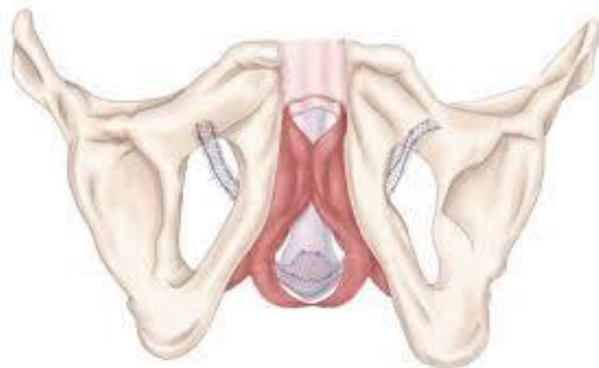
Figure 1 Bandelette urinaire AdVance™ chez l'homme. Source: Gracieuseté de American Medical Systems., 2016.

Il est normal de ressentir un léger engourdissement ou une sensation de brûlure au scrotum et au périnée pendant plusieurs semaines après la chirurgie. Parlez-en à votre chirurgien lors de votre rendez-vous de contrôle.