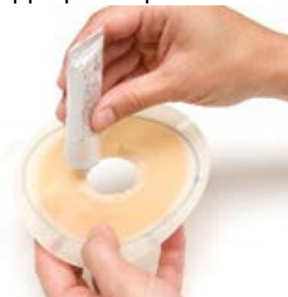
Figure 8 Application de la pâte.