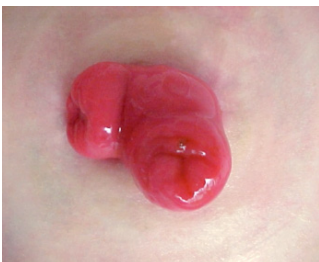
Figure 3 Stomie cintrée en boucle ou en anse.