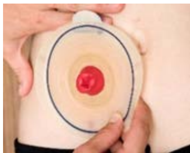
Figure 9 Collerette autour de la stomie.