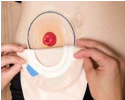
Figure 10 Pose du sac sur la collerette.