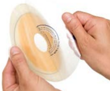
Figure 7 Retrait de la pellicule protectrice.