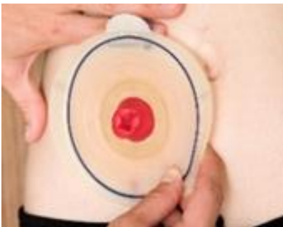
Figure 9 Collerette autour de la stomie.