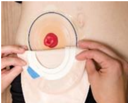
Figure 10 Pose du sac sur la collerette.