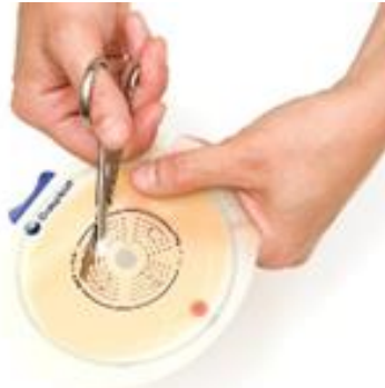
Figure 6 Découpage de l'ouverture.