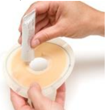
Figure 8 Application de la pâte.