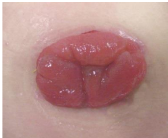
Figure 2 Stomie terminale.