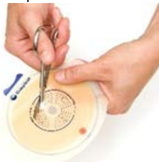
Figure 6 Découpage de l'ouverture.