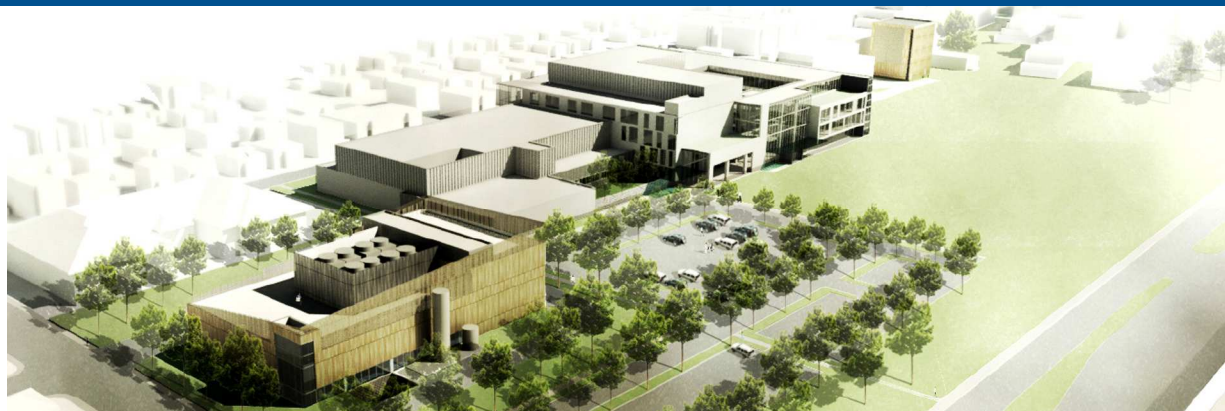
Solution immobilière projetée - Vue de la phase 1 du nouveau complexe hospitalier à Québec

Le projet du Nouveau complexe hospitalier (NCH), sur le site de l'Hôpital de l'Enfant-Jésus (HEJ), amorce sa phase 1, qui permettra, notamment, la construction du Centre intégré de cancérologie. Toute la population de l'est du Québec bénéficiera de services de pointe dans un complexe ultramoderne.