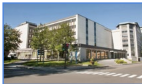
Hôpital Saint- François d'Assise 10, rue de l'Espinay, Québec (Québec) G1L 3L5

Les activités de recherche fondamentale, clinique et évaluative du Centre de recherche du CHU situé à l'Hôpital de l'Enfant-Jésus sont axées sur la traumatologie, la santé des populations, le génie tissulaire, la médecine régénératrice, la médecine d'urgence et les soins intensifs.