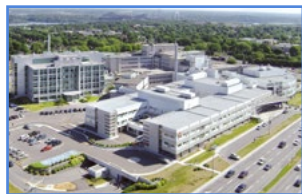
CHUL 2705, boulevard Laurier, Québec (Québec) G1V 4G2

Le CHUL est un hôpital de soins spécialisés et surspécialisés qui comprend une urgence régionale à très fort volume d'activités. Il est le centre de référence psychiatrique adulte de l'ouest de la grande région de Québec et le centre de pédiatrie et d'obstétrique «Centre mère-enfant Soleil» (CMES) régional et suprarégional pour l'Est du Québec. Le regroupement de la pédiatrie et de l'obstétrique au CMES propose une approche des soins qui favorise la participation de l'ensemble de la famille. L'infrastructure physique pour les services cliniques comprend des lits d'hospitalisation, des activités ambulatoires, des services de consultations externes, des salles d'opération et des civières d'urgence.