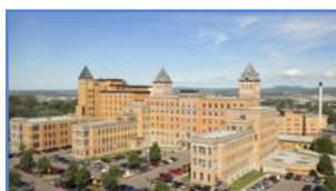
Hôpital du Saint-Sacrement 1050, chemin Sainte- Foy, Québec (Québec) G1S 4L8

De plus, il comprend un centre de recherche intégré au Centre de recherche du CHU et le Centre ménopause Québec.