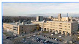
Hôpital de l'Enfant-Jésus 1401, 18 e Rue, Québec (Québec) G1J 1Z4

Le CHUL dispose également d'un important centre de recherche intégré au Centre de recherche du CHU. Près d'une quinzaine de psychologues travaillent au CHUL dans divers secteurs d'activités : psychogériatrie, psychiatrie adulte, pédopsychologie médicale, prématurité, etc.