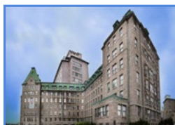
L'Hôtel-Dieu de Québec 11, côte du Palais, Québec (Québec) G1R 2J6

Les activités de recherche fondamentale, clinique et évaluative du Centre de recherche du CHU situées à l'Hôpital du Saint-Sacrement sont axées sur l'ophtalmologie et la sénologie.