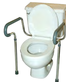
Appuis-bras fixés à la toilette