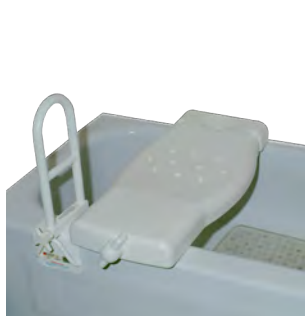
Planche de bain