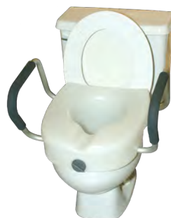
Siège de toilette surélevé avec appuis-bras (s'assurer d'une bonne stabilité)