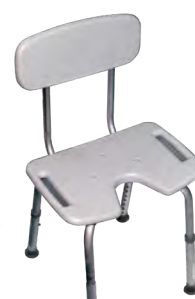
Chaise de bain