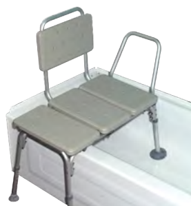
Banc de transfert pour le bain