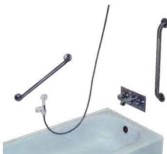
Douche-téléphone et barres d'appui