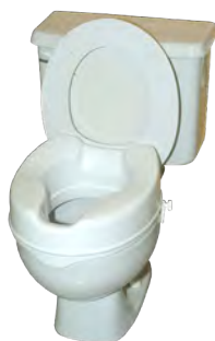
Siège de toilette surélevé