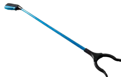
Pince de préhension