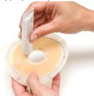
Figure 8 Application de la pâte.