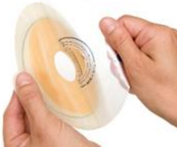
Figure 7 Retrait de la pellicule protectrice.