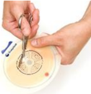
Figure 6 Découpage de l'ouverture.