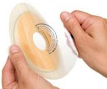
Figure 7 Retrait de la pellicule protectrice.